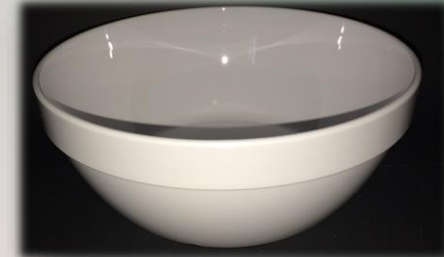
Schüssel rund 1.0l Ø 175mm 70 763 0090 / transparent 0001