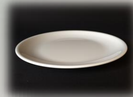
Dessertteller Ø 190 mm 41 413 0090