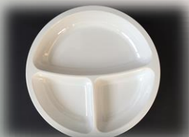
Teller 3x unterteilt Ø 258 mm 41 535 0090