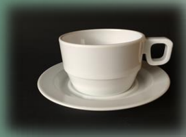
Tasse Unterteller 41 613 0090 / 40 614 0090