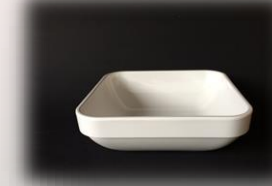
Schale rechteckig 115x115mm 0.25l/H39mm 41 308 0090