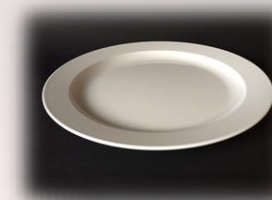
Flachteller Ø 258 mm 41 228 0090