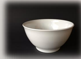
Bol Ø 138 mm 0.6l/H73mm 41 235 0090