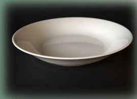
Suppenteller Ø 214 mm 41 416 0090