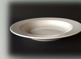
Suppenteller Ø 239 mm 41 229 0090