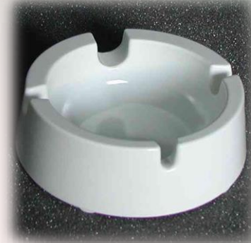
Aschenbecher mit Zigarrenhalter Ø 11.5cm / 60 068