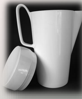
Krug mit Deckel 70 945 0090