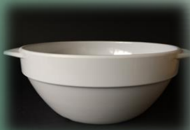
Schale mit Henkel Ø 175 mm 1.2l/H73mm 41 761 0090