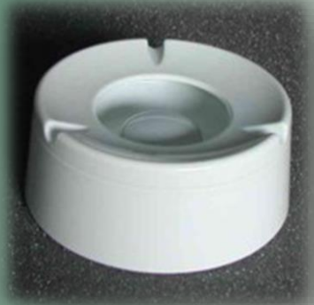
Windascher klein Ø 11cm / 60 079