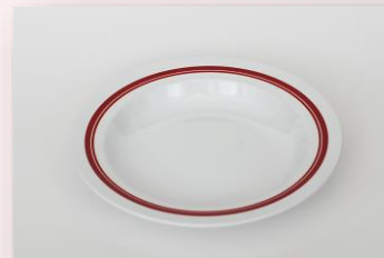
Suppenteller 30 229 0088