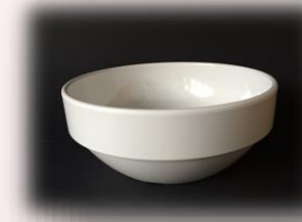
Dessertschale Ø 150 mm 0.3l/H34mm 41 722 0090