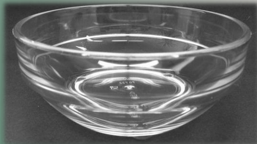
Salatschale rund 0.4l Ø 124mm 70 722 0001