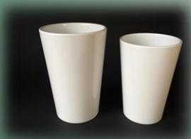
Becher 0.2 l / 0.3 l 40 002/003 0090