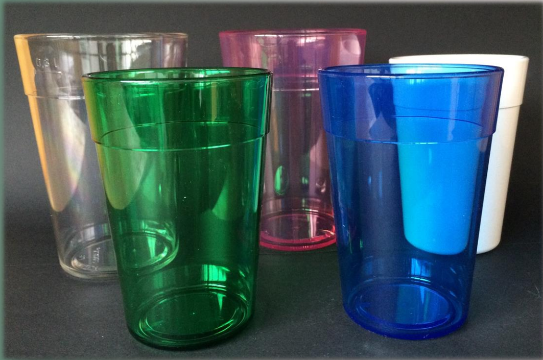
Mehrwegbecher 0.2l/0.3l/0.4l/0.5l 70 802 / 70 803 / 70 804 / 70 805