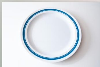
Dessertteller / Flachteller 30 062 0086 / 30 228 0086