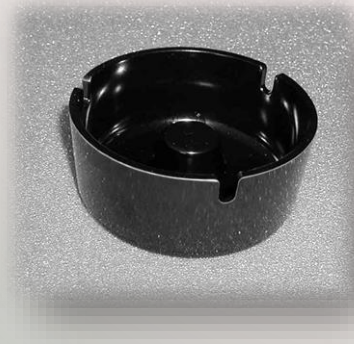
Aschenbecher mit Glutlöscher Ø 9.5cm / 60 041