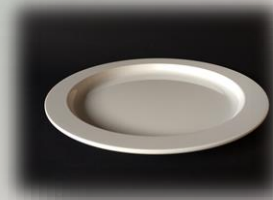
Dessertteller Ø 193 mm 41 062 0090