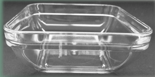
Dessertschale eckig 0.4l 115x115mm 70 308 0001