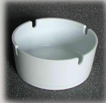
Aschenbecher schlicht Ø 10.5cm / 60 044