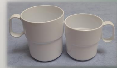
Teebecher gross 0.35l / klein 0.2l 70 811 gross / 70 812 klein