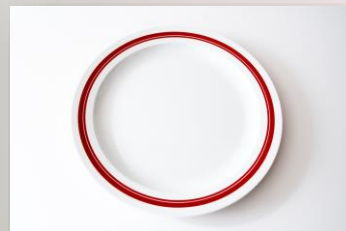
Dessertteller / Flachteller 30 062 0088 / 30 228 0088