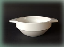
Schale mit Henkel Ø 122 mm 0.35l/H50mm 41 227 0090