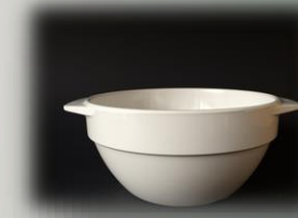
Suppenschale mit Henkel Ø134 mm 0.6l/H65mm 41 762 0090