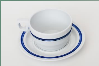
Tasse Unterteller 30 613 0087 / 30 614 0087