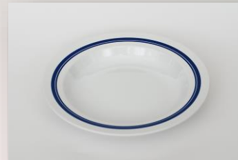
Suppenteller 30 229 0087