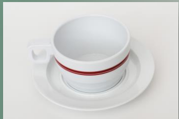
Tasse Unterteller 30 613 0088 / 30 614 0088