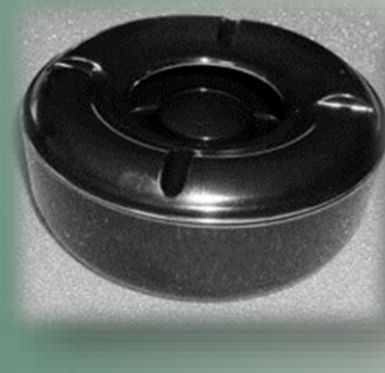
Windascher gross Ø 14.5cm / 60 078