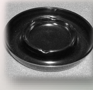
Aschenbecher flach Ø 14cm / 60 050