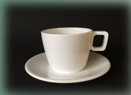
Mokkatasse Unterteller 40 407 0090 / 40 411 0090