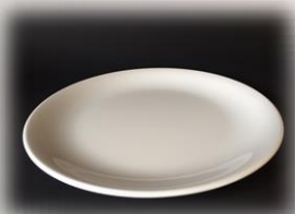
Flachteller Ø 232 mm 41 414 0090