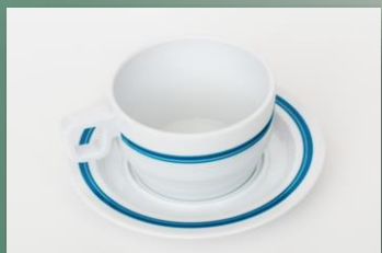
Tasse Unterteller 30 613 0086 / 30 614 0086