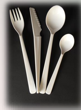
Besteckgarnitur 70 310 0090