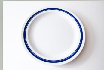
Dessertteller / Flachteller 30 062 0087 / 30 228 0087