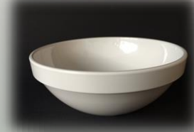
Schale Ø 175 mm 1.0l/H69mm 41 763 0090