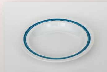
Suppenteller 30 229 0086